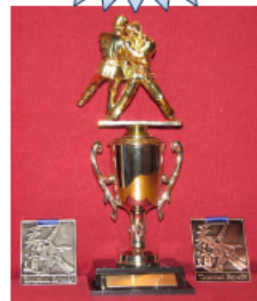
TROPHÉES pour les premiers Médailles pour les 2 èmes & 3 èmes

SÉLECTION DES JEUX DU CANADA 2015 CATÉGORIE U20 (96-97-98-99) Judogi bleu et blanc obligatoire (ou bleu-blanc réversible) pour les U20 seulement Début des combats 8h30